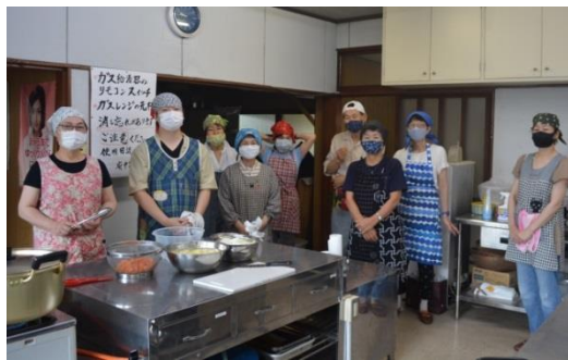
ぎおんさんの森食堂、次回、8月23日(日) 17時~18時30分、府中公民館です。

ライスは、鶏肉たっぷり「◯◯モンドカレー」味。でも不思議なことに、いつも違う味、そして美味しい。作り手が、毎回変わっているからかもしれません、子どもたちには人気ようです。それは、「笑顔」というスパイスがよく効いているから? みんなで食べると不安が消えるから? その謎を解明しに食べに来ませんか? 毎月第4日曜に開催しています。なお、コロナ禍により、大人たちだけでカレーを作っています。